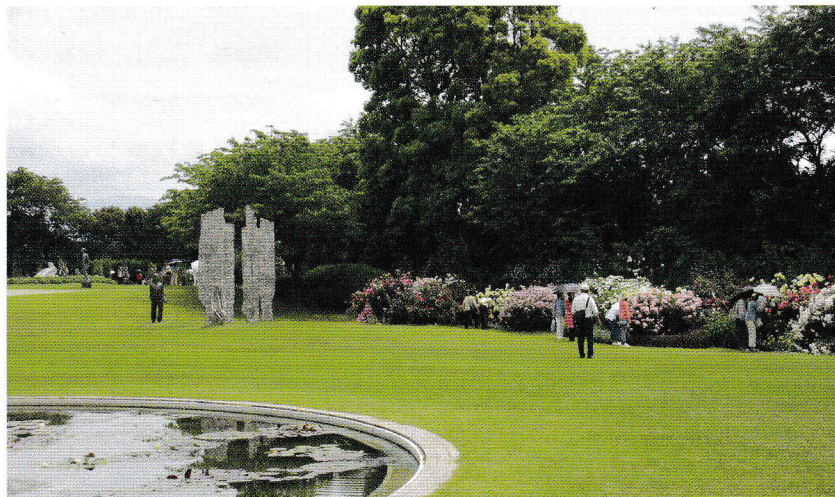
5月29日 総会・レクリエーション クレマチスの丘庭園

伝統文化は師から子弟に、そしてその子弟にと技術や精神が継承されながら、長い歴史を刻んで来た世界です。今、そこに黄色信号が灯りはじめているのではないのでしょうか。要因は複合的で、少子化・趣味の多様化・経済や職場環境などさまざまありますが、若い方が入って来ません。一方で高齢化はすすみます。問題はとても深刻です。文化庁のこども教室の成果に託す一方で私達は、少しでもチャンスが生まれる様、積極的な教授活動を始めなければなりません。将来を見ずると現在の私達の責務なのではないでしょうか。