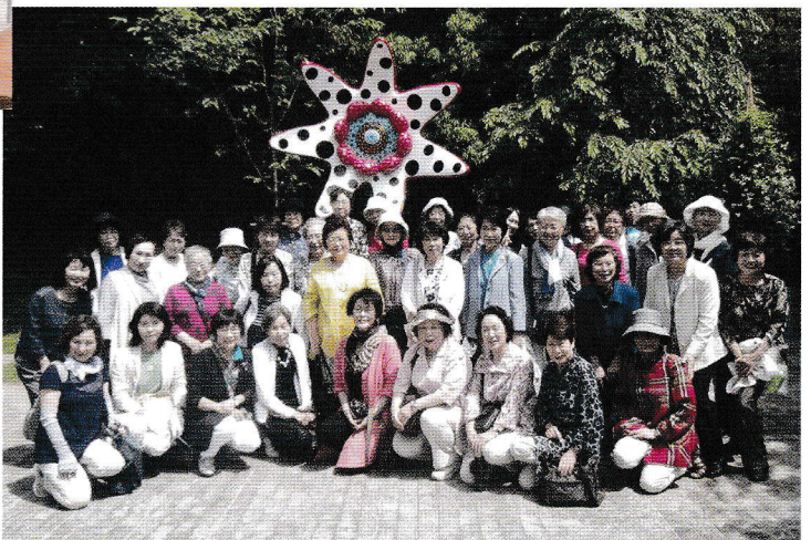
クレマチスの丘、草間彌生作品の前にて