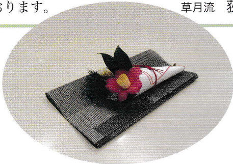
新春のつどい (テーブル花)