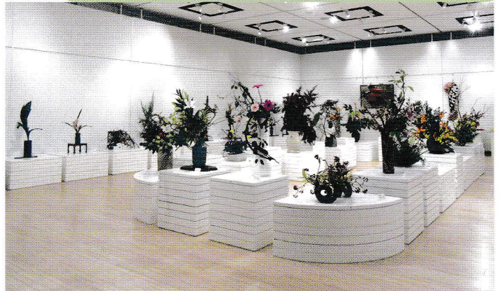
いけばな諸流展 (オープンスペース)