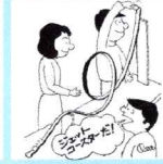
ジェットコースター