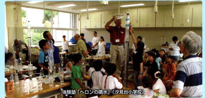
体験塾「ヘロンの噴水」(汐見台小学校)