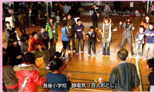
長後小学校 静電気「百人おどし」

小学校の課外授業等への協力や地域イベントへの参加など地域との連携に努めています。