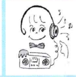
紙コップヘッドフォン