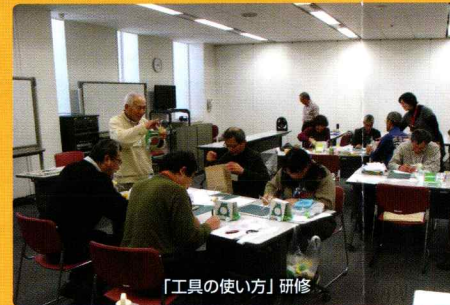
「工具の使い方」研修