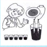
水と色の ファンタジー