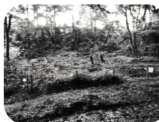
第17回 ビオトープ(上和田)