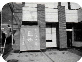
第15回 とうふ工房豆畑