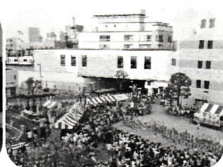
第19回 駅と共に輝く市民パワ