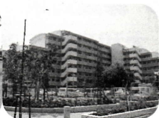
第14回 市営鶴間台住宅