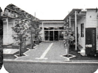
第13回 障害者自立支援セン