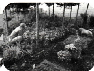
第20回 保存樹林への植栽活動