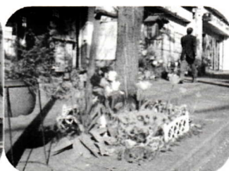
第18回 つきみ野まちづくり 委員会の活動