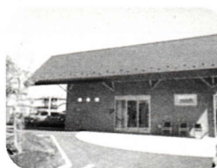
第20回 もみの木カフェ