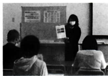
コース説明の様子