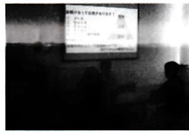
パソコンスキルアップ科 模擬授業の様子

今年度、神奈川県では新型コロナウイルス感染症拡大の影響による緊急雇用対策として「即戦力」委託訓練2月生(2ヵ月コース)を追加実施することとなりました。研修センターでは、医療事務(医科・歯科)PC科、介護職員初任者研修科、パソコンスキルアップ科の3コースについて11月18日(木)、26日(金)、12月1日(水)にコース説明・学校見学会を実施しました。参加者は就職活動や資格取得のサポート等を熱心に聞いていました。また、12月1日(水)には訓練の委託元である神奈川県立東部総合職業技術校二俣川支所のご担当者様も出席され、見学会の視察がありました。