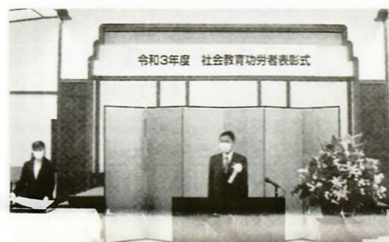
表彰式であいさつする末松信介文部科学大臣(11月5日)