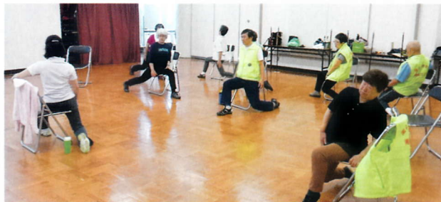
吹き矢の準備体操

楽しみとともに大事なことは、住み良いまちづくりのために、スポーツの振興で市民の健康増進をはかっていくことだそうです。より多くの方に知っていただくために、ブログ等での情報発信にも力を入れており、他分野の市民活動団体や地域との連携も積極的に深めていくように努めています。