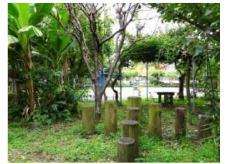
▲山王塚公園(通称なかよし公園) 大和の森・公園シリーズ⑦⇒4面