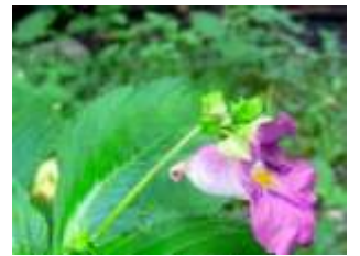
▲上和田野鳥の森のツリフネソウ 大和の森・公園シリーズ③⇒4面

あの手この手のマークの間のSはsolution(解決)のSです。 大和市民活動センター[拠点やまと] 第95号 2015年6月1日発行