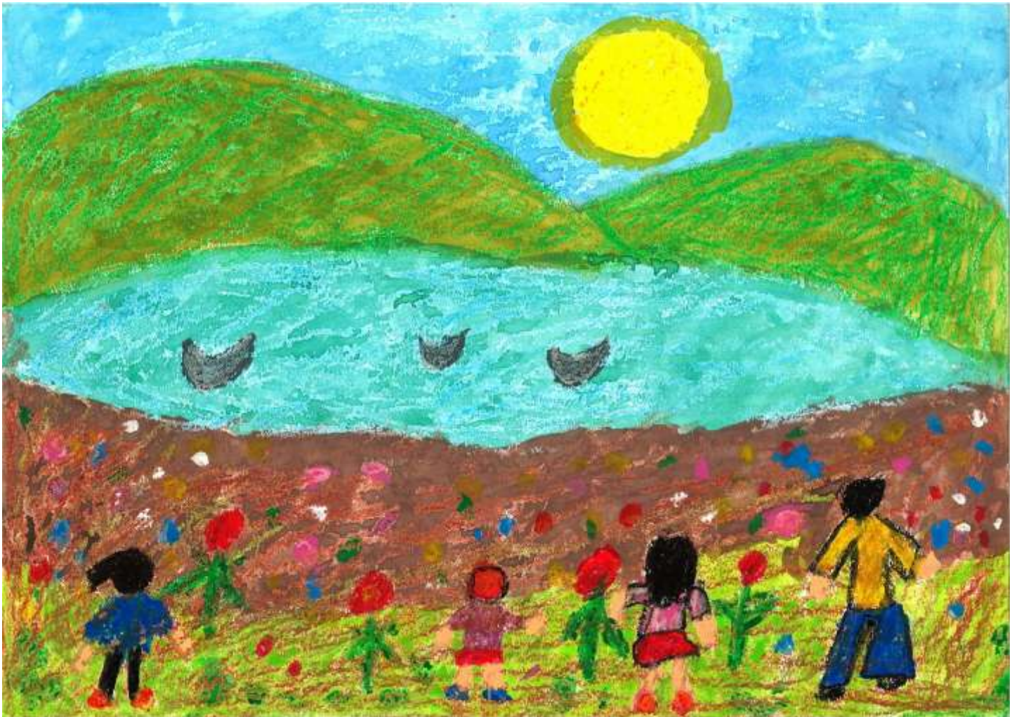
<やまと国際アートフェスタ>作品シリーズ その3

あの手この手のマークの間のSはsolution(解決)のSです。 大和市民活動センター[拠点やまと] 第95号 2015年6月1日発行