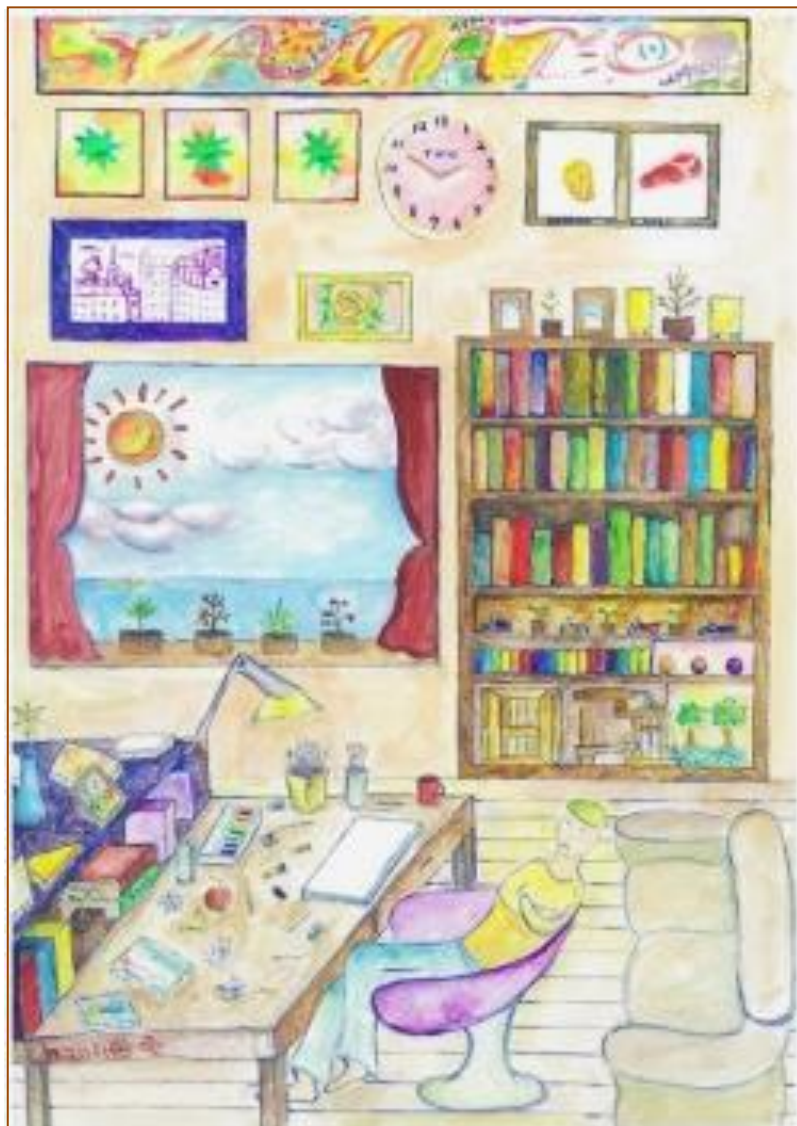
「YAMATO イラストレーションデザインコンペ」作品シリーズ その9「夢想」

あの手この手のマークの間のSは solution(解決)のSです。 大和市民活動センター[拠点やまと] 第91号 2015年2月1日発行