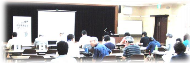
昨年の協働事業提案公開プレゼンテーションの様子