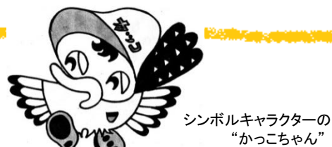
シンボルキャラクターの 「かっこちゃん」