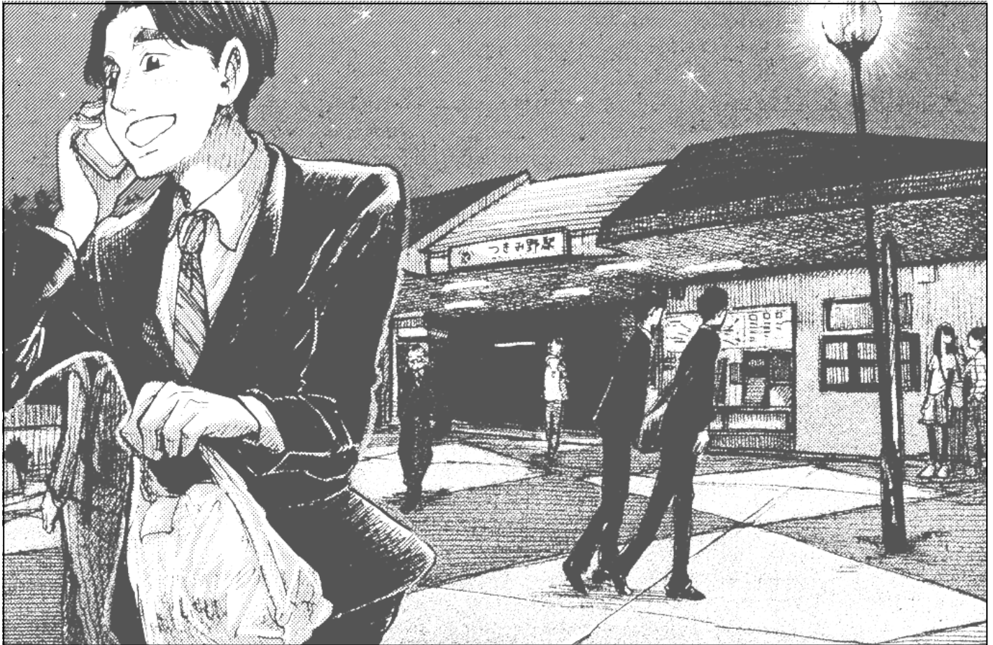
大和の駅6シリーズ・その2 つきみ野駅 絵・大澄 剛

あの手この手のマークの間のSは solution(解決)のSです。 大和市民活動センター[拠点やまと] 第76号 2013年 11月 1日発行