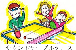
サウンドテーブルテニス (視覚障がい者用 卓球)