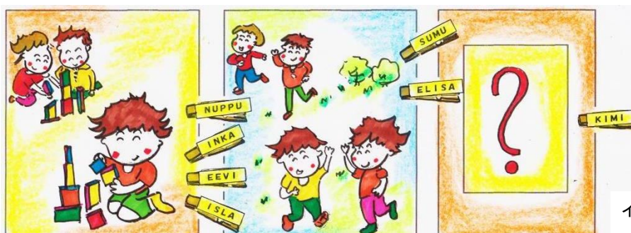
イラスト: 望月則男

今号は前号に続き「フィンランドリポート」<その2>になりました。 記・小杉皓男[拠点やまと]広報係 2013/01/03