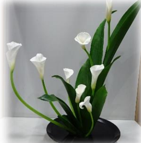
パテルギウス玄関の 4月10日の生け花