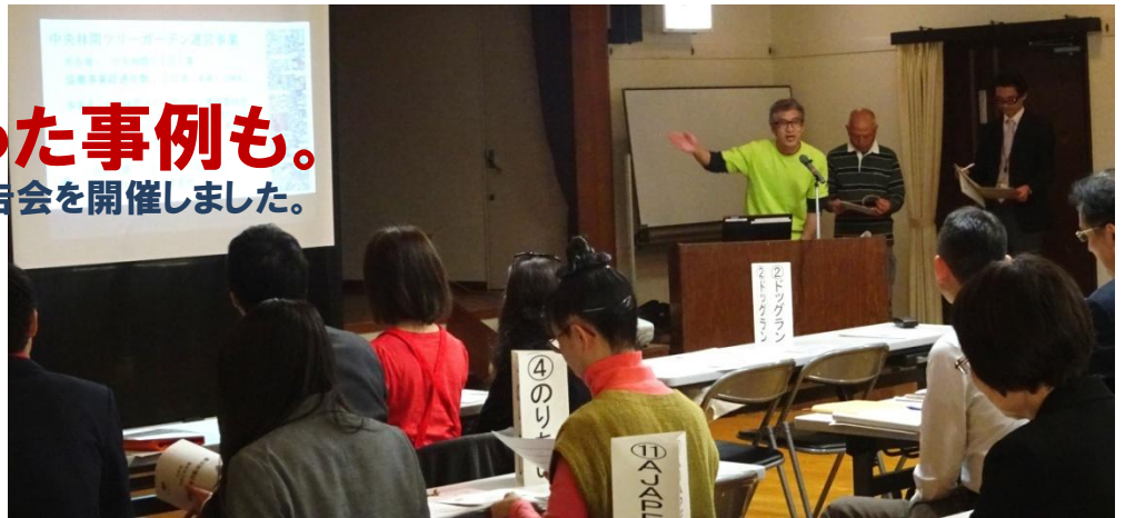
中央林間ツリーガーデン運営委員会はパワフルな発表

4月26日(水)11時から、平成28年度に実施された市民活動推進補助金事業の報告会を、13時から協働事業の報告会を、大和市勤労福祉会館で開催いたしました。