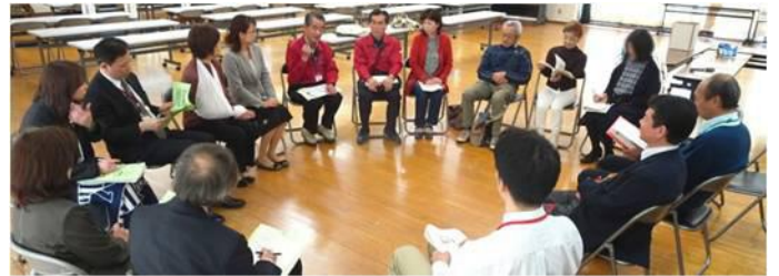
補助金事業では、今年も車座の意見交換会が開かれた。

17事業のうち、チャレンジ離乳食教室は28年度、プレススクール事業は29年度で終了となりますが、前者は補助金事業から始まり、協働事業を経て今年度からは市の事業として引き継がれることとなり、大きく育て離陸したといえます。