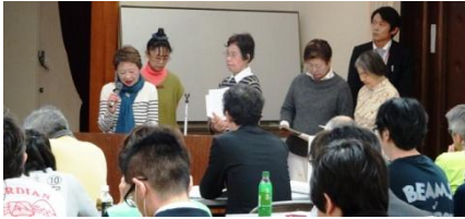
「のりあい」は介助者が交代で感想を発表