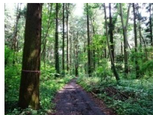
▲大規模緑地のひとつ中央林間自然の森(つるま自然の森)