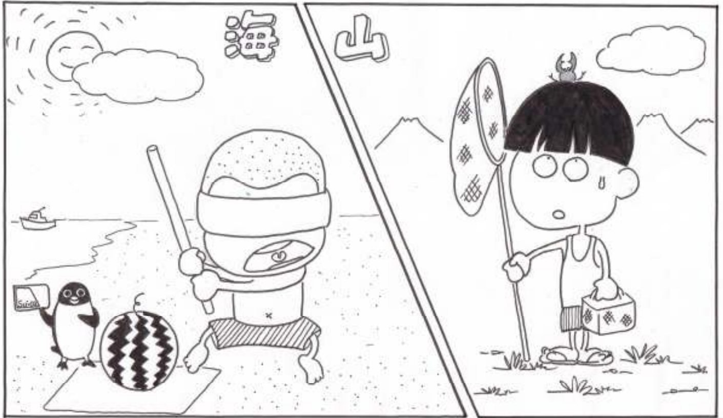
表紙絵：ノース・アイランド2号(大和市職員)