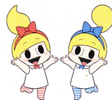
ミビョーナとミビョーネ （神奈川県）