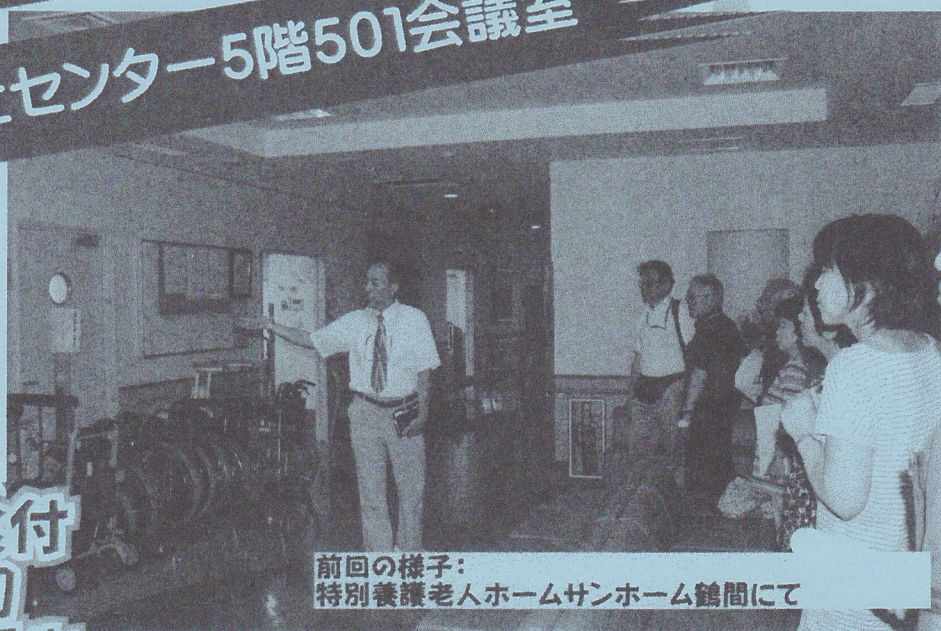
前回の様子: 特別養護老人ホームサンホーム鶴間にて

定員:25名 対象:一般 参加費無料:昼食付 9月8日(月)〆切 先着順、初参加優先