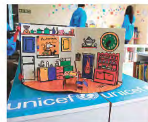
ちっちゃな図書館