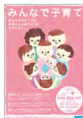
ホットラインポスター