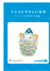
子どもにやさしい空間