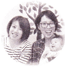
ひろばスタッフ 音楽セラピスト