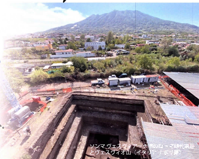
ソルマヴェスウイアー火山のローマ時代遺跡 とヴェスウイオ山（イタリア）（杉山浩平氏）