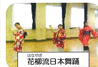
はなやき 花柳流日本舞踊