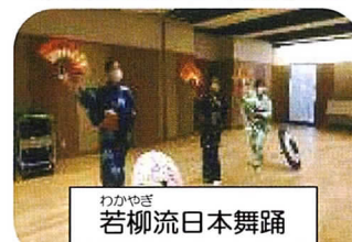
わかやき 若柳流日本舞踊