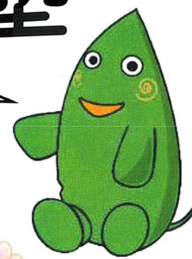
大和市イベントキャラクター 「ヤマトン」