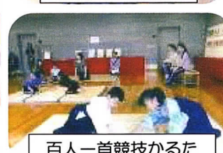
百人一首競技かるた