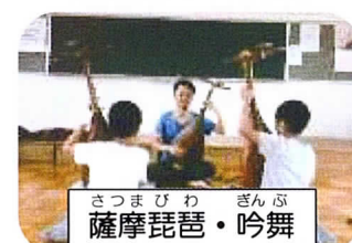
さつまびわ ざんぷ 薩摩琵琶・吟舞