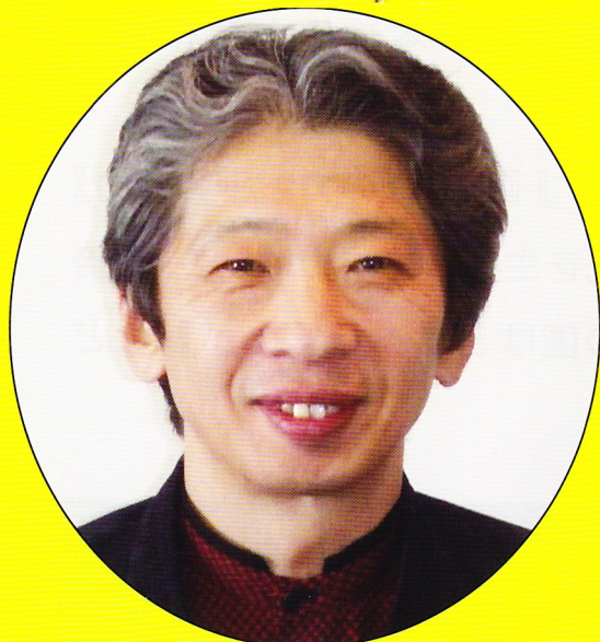
東京大学大学院教授 九条の会（全国事務局長）